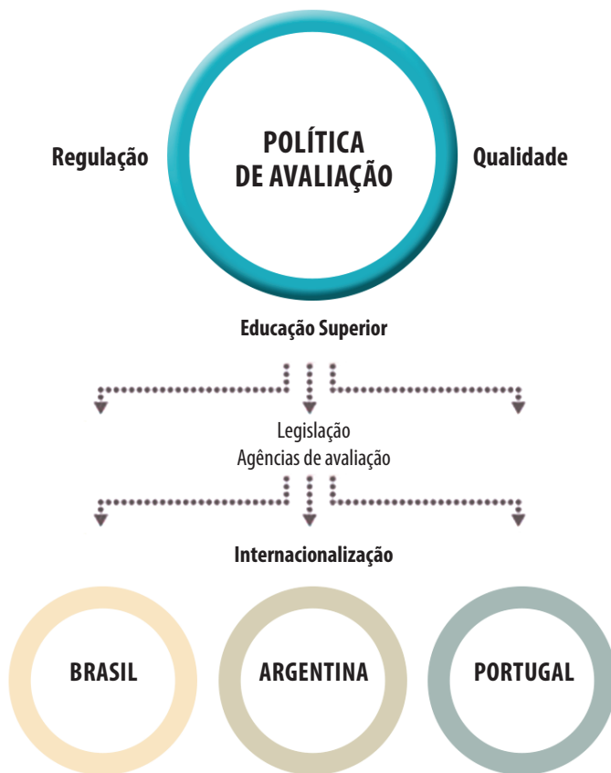
Figura 2. Desenho do estudo comparativo