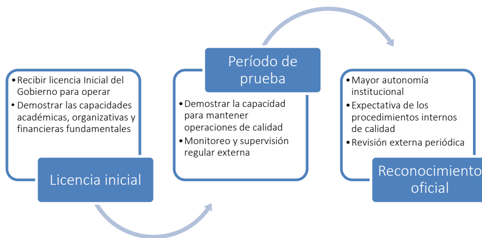
Ilustración 4. Proceso básico de acreditación institucional.

En los casos en que tiene lugar la acreditación institucional, generalmente el proceso es como se describe en la Ilustración 4: