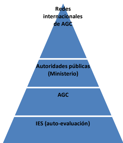
Ilustración 1. Pirámide de la garantía de calidad en la educación superior.

Szanto (Costes et al., 2010) propuso una pirámide de GC de cuatro niveles destinada a garantizar la calidad global de un sistema de ES, resumida en la Figura 1.